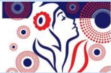
Le Thé Dansant organisé pour le 14 juillet

Cette année encore, nous n'avons pas dérogé à la tradition, puisque nous étions une centaine de personnes à partager ce moment de convivialité, qui s'est poursuivi avec un thé dansant animé par un chanteur guitariste.