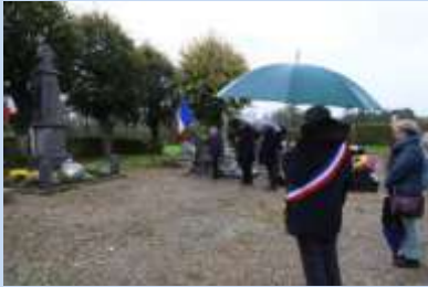
Commémoration du 11 novembre au monument

Journée Nationale de commémoration de la Victoire et de la Paix